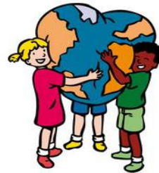
We hebben hart voor elkaar