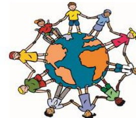
We zijn allemaal anders