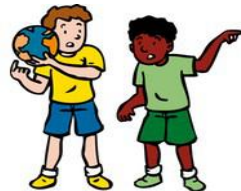
We lossen conflicten zelf op