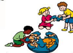
We dragen allemaal een steentje bij