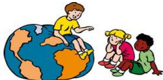
We hebben oor voor elkaar

Wat ons team aanspreekt is de positieve insteek van de Vreedzame School. We doen veel aan zelfstandigheid en verantwoordelijkheid van kinderen en daar sluiten de uitgangspunten van de Vreedzame school goed bij aan. Met behulp van dit programma willen we het sociale klimaat op school versterken. Kinderen kunnen heel veel en dat willen we zo veel mogelijk benutten.